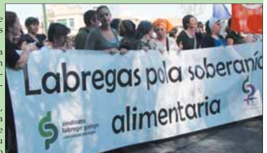
A soberanía alimentar foi o tema principal da Marcha Mundial das Mulleres celebrada en Vigo o pasado 18 e 19 de outubro

Non se trata dun comportamento egoísta, senón ao contrario. Habida conta da súa forza perante doutras zonas do mundo, trátase de permitir que os outros países exerzan o seu dereito á soberanía alimentar e acadar, tanto no norte coma no sur, unha agricultura labrega sostíbel.