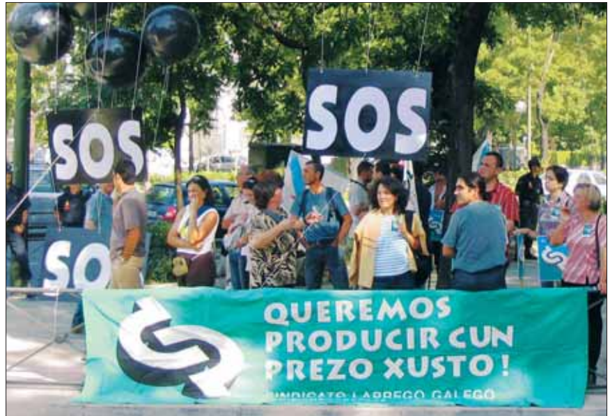
Concentración antes dunha das manifestacións na contra da PÁC realizadas en Madrid.

As labregas e labregos queremos manter a biodiversidade das plantas e animais, e esiximos que se respecte os nosos dereito colectivo a conservar, voltar a sembrar, intercambiar e vender sementes producidas nas nosas explotacións. Este dereito conleva a prohibición total do organismos xenéticamente modificados.