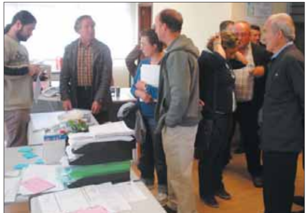
Entrega do documento no concello de Cospeito.

■ Que se solicite igualmente un informe ao Instituto de Biodiversidade Agraria E Desenrolo Rural (IBADER), no que se recollan as afectacións e impactos que a xuízo de dita institución científica pode producir a actividade mineira que nos ocupa.