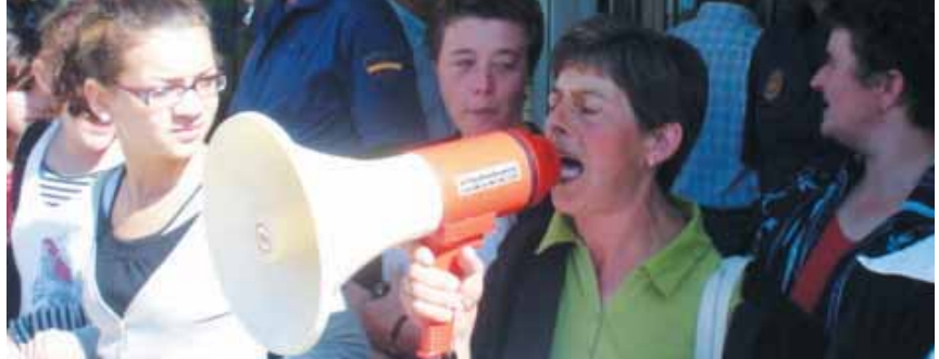
As nais e pais de Abadín levaban meses mobilizándose polo mantemento da E.S.O. En abril deste ano a directora do I.E.S. "Aquilino Iglesia Alvariño" tentou axilizar o desprazamento do alumnado enviándolles á casa os impresos de traslado. Mais estas familias teñen moi claro onde queren que vivan e se eduquen os seus fillos e fillas. A forza da súa loita é un exemplo para tod@s as nais e pais do País.

Hai unha evidente desigualdade de oportunidades para os nenos e nenas que teñen que pasar no transporte máis dunha hora antes de chegar ao centro educativo e outro tanto ao final da xornada escolar, tal e como sería o caso dos alumnos e alum-