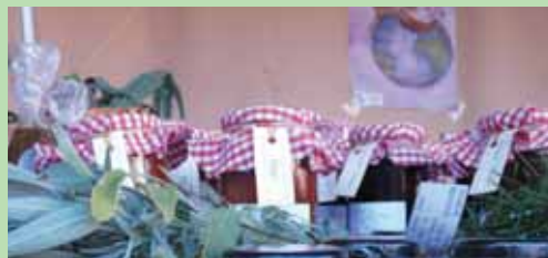
Tamén tivo lugar un mercado de produtos caseiros (tartas, ovos, legumes, empanadas, pan, marmeladas...) na praza de Europa, sita en Área Central, en Santiago de Compostela. O produto caseiro é o feito por nós e nas nosas casas, non podemos permitir que as empresas se apropien do prestixio acadado grazas ao noso saber facer mantido ao longo dos anos.