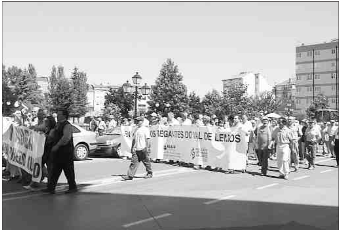
A Comunidade de Regantes de Lemos manifestouse en Monforte contra as taxas o 13 de xullo

Mesmo sen regar, as terras polas que pasa o regadío están obrigadas a pagar un canon de 150 euros (25.000 pesetas) por hectárea.