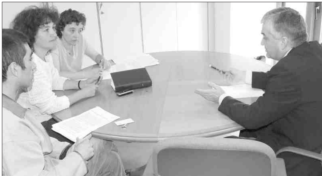
A comitiva do SLG transmitiulle a preocupación do sector ao Conselleiro de Industria

O Sindicato Labrego Galego fixo público o seu rexeitamento frontal a esta permisividade legislativa que antepón os intereses económicos das empresas