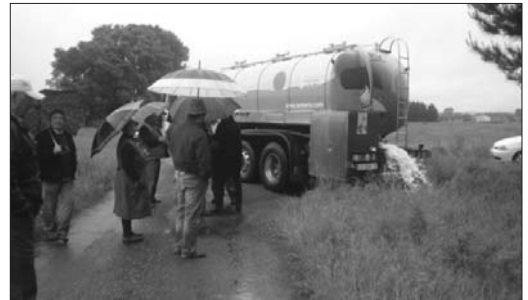
O valeirado de cisternas en varios puntos do País foi a resposta inmediata á agresión, adoptada polos gandeiros e gandeiras e apoiada polo SLG. Na foto en Cospeito, A Terra Chá.

Non podemos pasar por alto o feito de que o sector lácteo galego está sufrindo unha grave crise derivada da situación dos prezos por debaixo dos custos de produción: este é realmente o problema, e que se manifesta na absoluta prepotencia coa que a industria impón as súas condicións ás explotacións. O problema que se xerou na Mariña non é máis que a concreción máis cruda desta situación, e que só se resolverá cando consigamos garantía de recollida e de prezo que cubra os custos de produción e remunere dun xeito xusto o traballo. Este foi o lema das mobilizacións que o sector levou adiante en datas recentes, e todo parece indicar que imos ter que seguir.