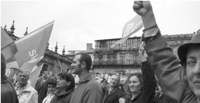
O Sindicato Labrego Galego participou na histórica manifestación a prol da nosa lingua que tivo lugar o domingo 17 de maio en Santiago de Compostela.

A lingua é un dos nosos sinais de identidade máximo como pobo e temos a obriga e responsabilidade de potencialo, garantindo a conservación deste noso patrimonio tan prezado, tomando con seriedade o deber de trasladarlllo ás futuras xeracións.