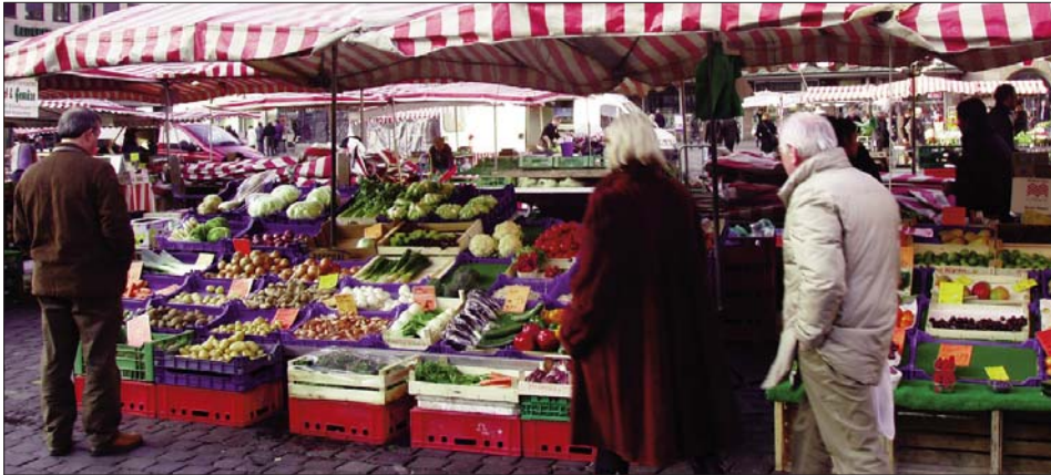
A desaparición dos mercados locais e as normas hixiénico sanitarias, están dificultando ás labregas e labregos a venda dos seus produtos, en moitos países do mundo.

A Soberanía Alimentaria é unha proposta da Vía Campesina, coordinadora da que forma parte o SLG, feita pública durante o Cumio Mundial da Alimentación da FAO, celebrado en Roma no ano 1996. Vía Campesina, define a Soberanía Alimentaria como o dereito dos pobos, dos seus países ou unións de estados, a definir as políticas agrarias e alimentarias sin dumping fronte a países terceiros . Esta é unha alternativa válida para o Norte e para o Sur.