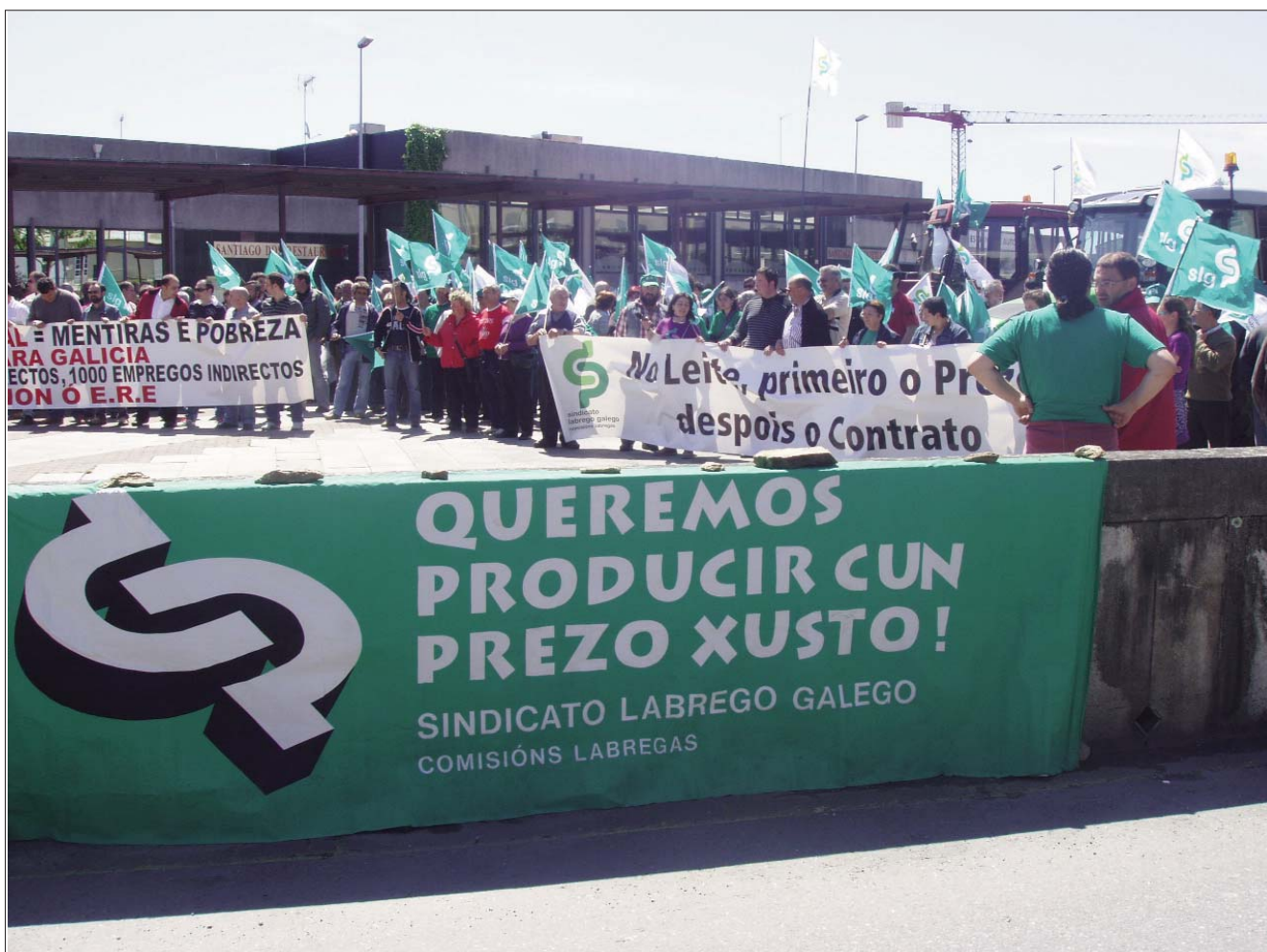
O SLG convoca a 300 gandeiros e gandeiras diante da Consellería de Medio Rural, contra a chantaxe de Lence e en demanda de prezo digno.

O sector do leite segue a sufrir as consecuencias dunha política neoliberal baseada na especulación e no enriquecemento do sector industrial e da gran distribución a costa da sobreexplotación do sector primario e do terceiro mundo. O capitalismo salvaxe, nos períodos de crise, só permite