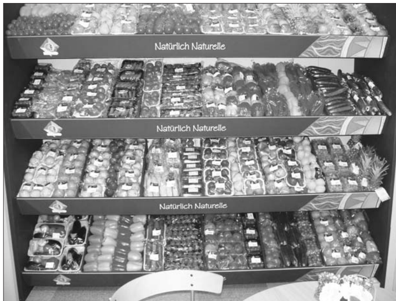
A produción ecolóxica e integrada que está en mans das multinacionais adoptan aspectos nocivos do modelo industrial con comportamentos irresponsables no uso de materiais contaminantes no envasado, na explotación das persoas, na intensificación, na deslocalización do produto e no alto custe enerxético do transporte.

A Soberanía Alimentaria, (dereito a decidir sobre as políticas agrarias e alimentares do noso pobo), implica primar o emprego dos recursos locais para a produción de alimentos, minimizando as materias primas importadas para a produción así como o seu transporte, significa reorientar a produción cara o mercado local e de proximidade, adoptar estratexias para manter ás persoas no agro no lugar de expulsalas, utilizando e expandindo o coñecemento e o saber local, desenvolvendo modelos responsables o servizo da eficiencia, do emprego e do medio natural.