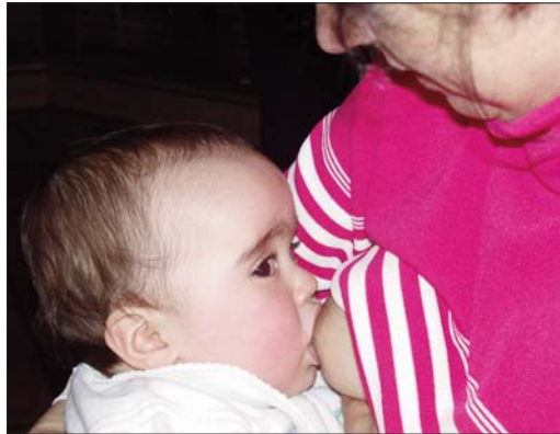
O amamentamento favorece a maduración do sistema nervioso, polo que tamén favorece o aumento do coeficiente intelectual, sobre todo en nenas/os prematurados.

Schwarz, especialista que dirixiu o estudo, sinala que "Canto máis tempo alimenta unha nai ao seu bebé, mellor para ambos os dous. O estudo proporciona outra boa razón para que as políticas sanitarias animen ás