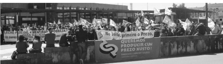
Vista da manifestación diante da Consellería o mércores 27 de abril