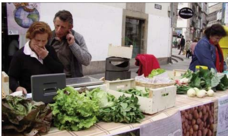
Comercio Xusto en Santiago de Compostela o 9 de maio de 2009

Facemos un chamado á Xunta de Galiza para que tome medidas e pare este sensentido que para o único que serviu foi para que algúns/as gañaran cartos con estes trámites e para limpar de produtoras/es os mercados.