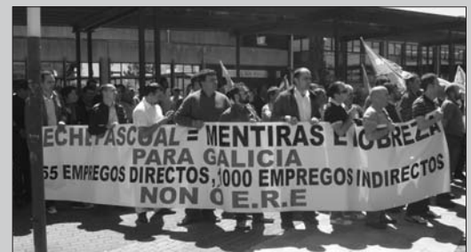
Na foto, o Comité de empresa de PASCUAL na mobilización convocada polo SLG en Santiago.

O informe desfavorable de Traballo ao ERE, é unha batalla gañada, pero aínda queda moita guerra por diante.